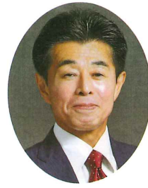
弥富市長 安藤正明